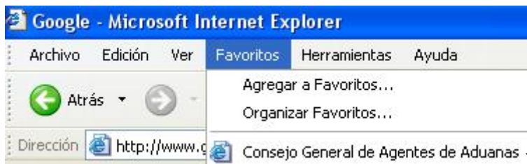
Imagen con el Menú Favoritos abierto, una de las opciones a elegir es el Consejo General de Agentes de Aduanas