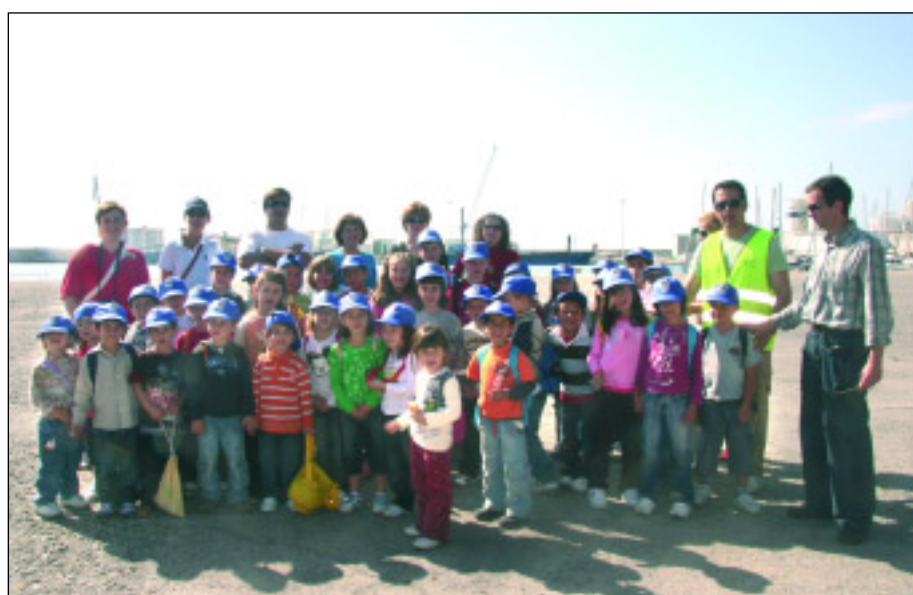
Uno de los grupos de escolares que han visitado el recinto portuario de Motril

Aunque el cuaderno está orientado al profesorado, también pueden hacer uso del mismo los grupos interesados en realizar una expedición detallada del recinto portuario, ya que dará respuesta a sus inquietudes y de una forma divertida y amena podrán conocer las instalaciones. También contiene una serie de actividades para realizar y debatir en el aula antes de la visita, espacios donde poder hacer anotaciones, observaciones y expresar pensamientos.